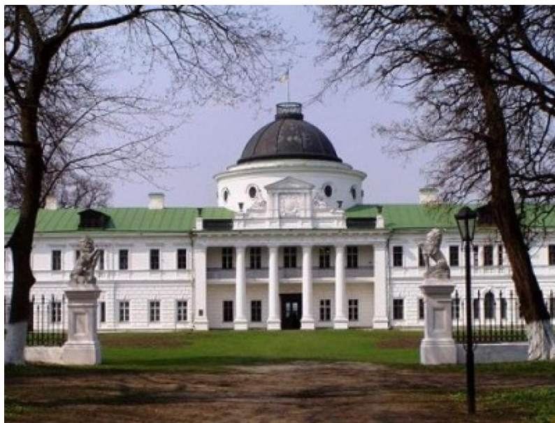
палац Петра Рум'янцева в Качанівці

Яскравими зразками класицизму в архітектурі кінця 18 ст. – початку 19 ст. є палац Петра Рум'янцева в Качанівці на Чернігівщині та палац Кирила Розумовського в Батурині.